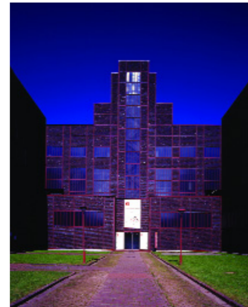
red dot design museum Essen

Intellectual property rights We recommend that all participants check whether the submitted concepts or product ideas, including their design and any inventions associated with them, are legally protected or should be legally protected. When the products are made public as part of the competition, they and any inventions associated with them, lose their "novelty". This means that intellectual property right applications, which are made afterwards, will only be possible at a restricted level or within certain deadlines. Where required, we will be pleased to put you in touch with specialist law firms, which will provide you with information.